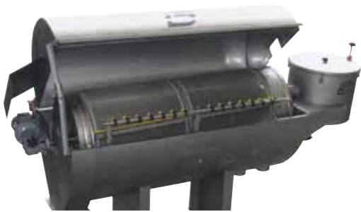
Separador de sólidos