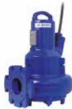
Bombas de alimentación